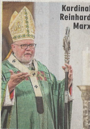
Kardinal Reinhard Marx

Marx sagte: „Wir werden diesen Tag so schnell nicht vergessen!“ Das